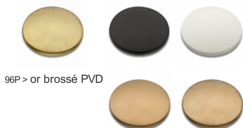
96P > or brossé PVD